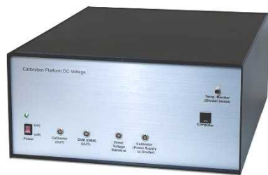
分圧器、スイッチボックス等の主装置