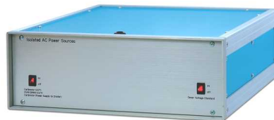
高絶縁 AC 電源